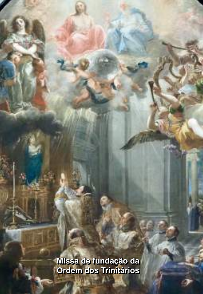
Missa de fundação da Ordem dos Trinitários