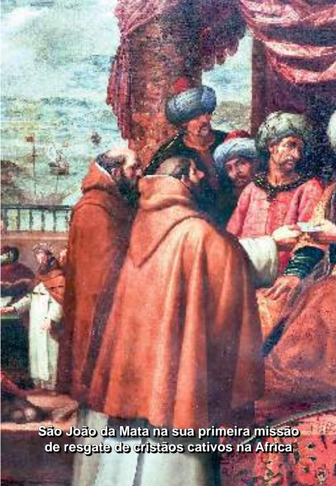
São João da Mata na sua primeira missão de resgate de cristãos cativos na Africa