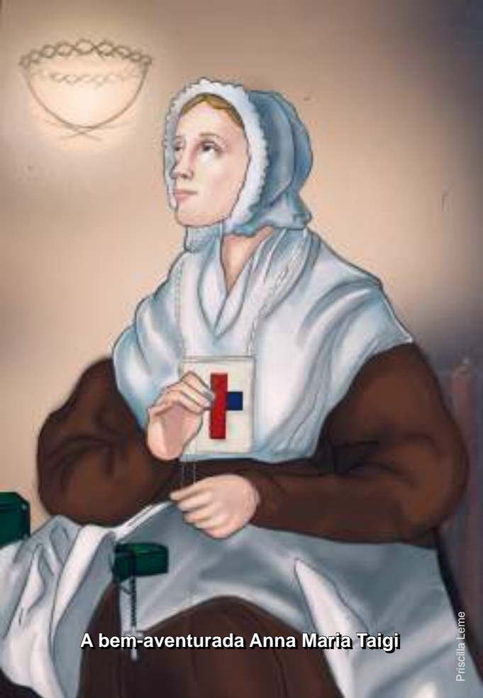
A bem-aventurada Anna Maria Taigi