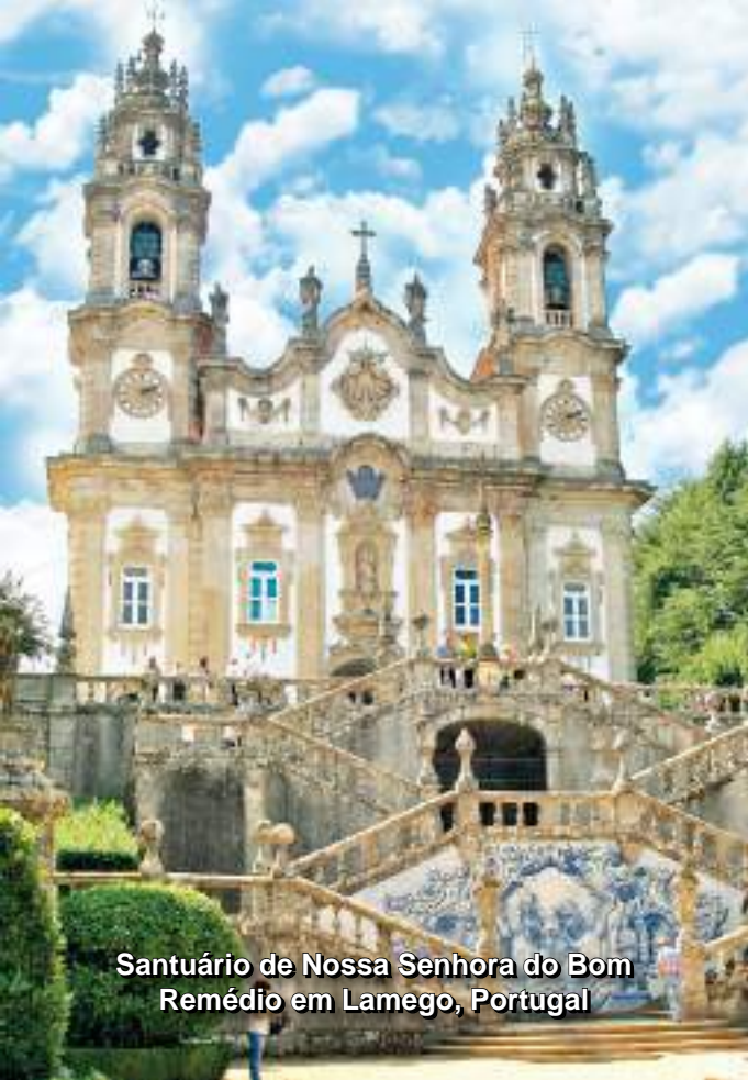
Santuário de Nossa Senhora do Bom Remédio em Lamego, Portugal