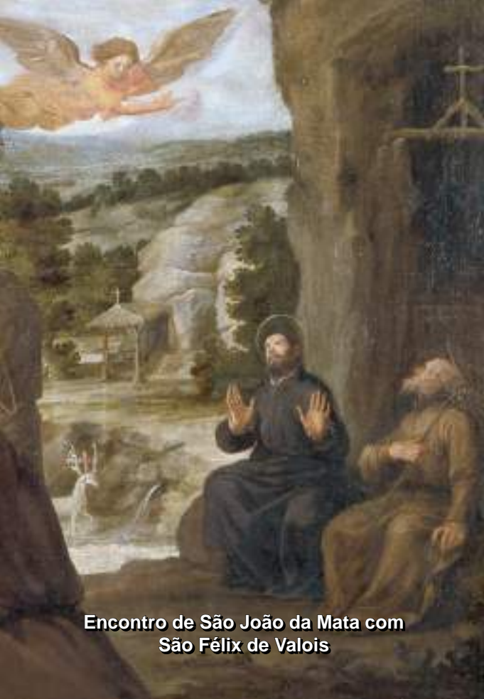
Encontro de São João da Mata com São Félix de Valois