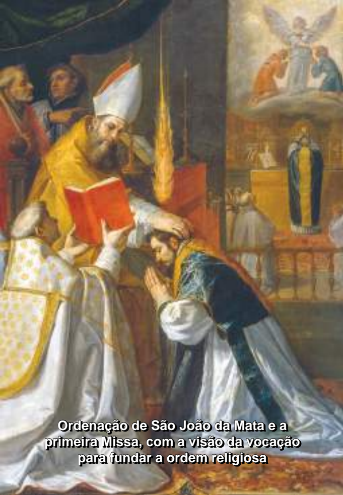
Ordenação de São João da Mata e a primeira Missa, com a visão da vocação para fundar a ordem religiosa