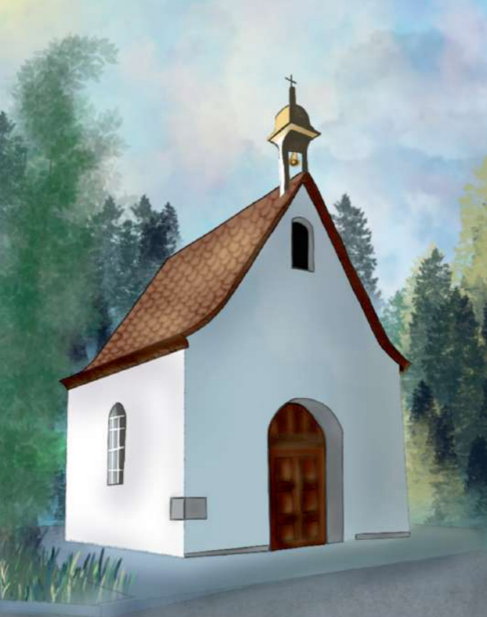
Santuário de Nossa Senhora de Schoenstatt - Atibaia (SP)