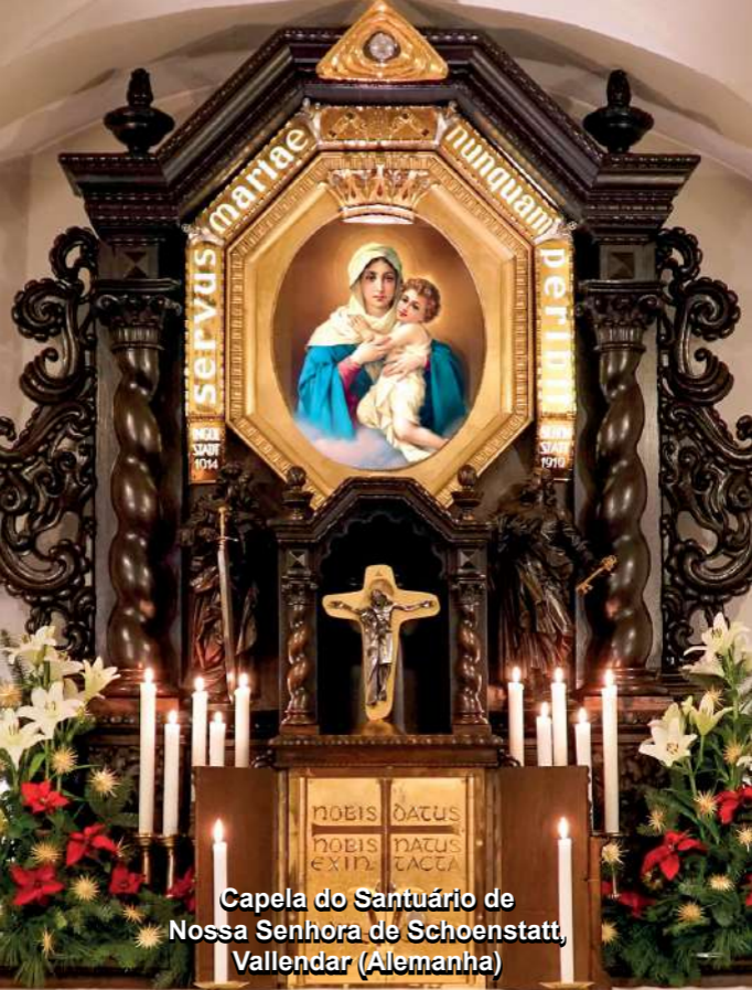
Capela do Santuário de Nossa Senhora de Schoenstatt, Vallendar (Alemanha)